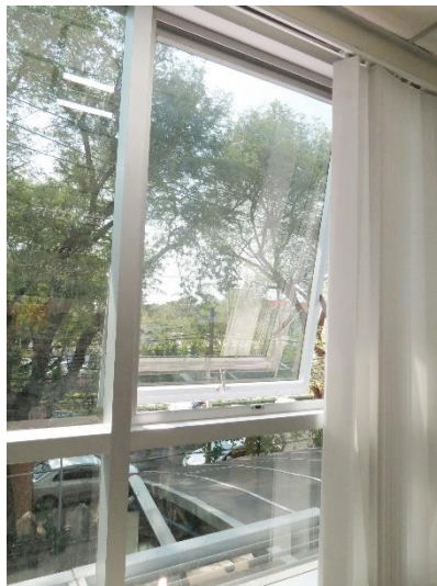
การถ่ายเทอากาศ