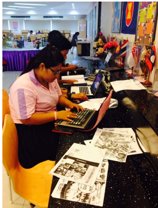
ห้องสมุดพณิชยการพระนคร - ใช้ปลั๊กพ่วง